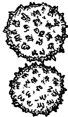
Рисунок 2 — Пыльцевые зерна хлопчатника ( Gossypium hirsutum L.)